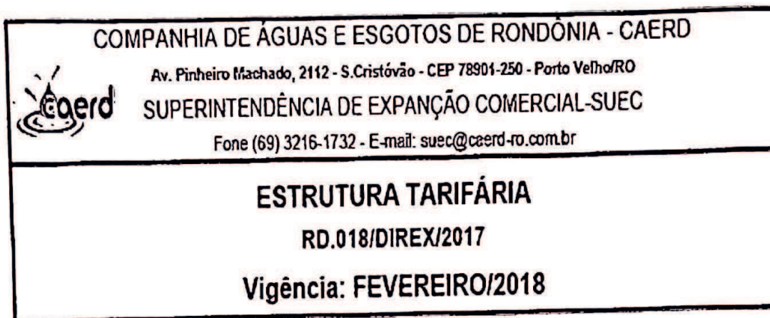
TABELA DE TARIFAS